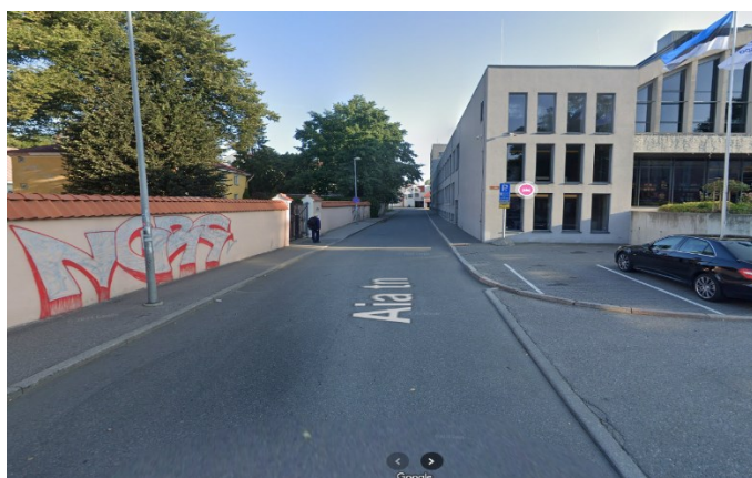
Kuvatõmmis nr 1. Vaade Aia tn-lt Kalev Spa taguse parkla poolt (Kanuti skatepargi lähedalt) suunaga Reval Spa.